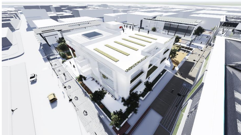
Fig 2. Vista aérea proyecto

El proyecto arquitectónico al estar emplazado entre las carreras 15 Bis y 15 BisA, le da la posibilidad de tener fachadas activas en todos sus lados, por tal motivo y al ser un elemento importante en el nuevo centro de manzana del Bronx, el proyecto debe convertirse en la puerta de bienvenida sobre la calle 9, a la plaza de encuentro del Bronx. Como tener esta relevancia en el complejo de equipamientos que configuran la nueva manzana del Bronx.