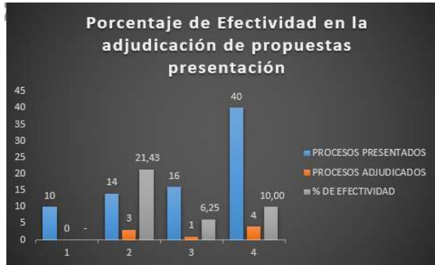
Figura 2. Porcentaje de Efectividad en la adjudicación de propuestas