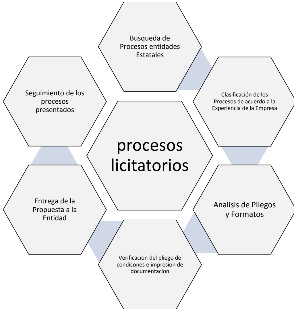
Figura 3. Mapa de Procesos