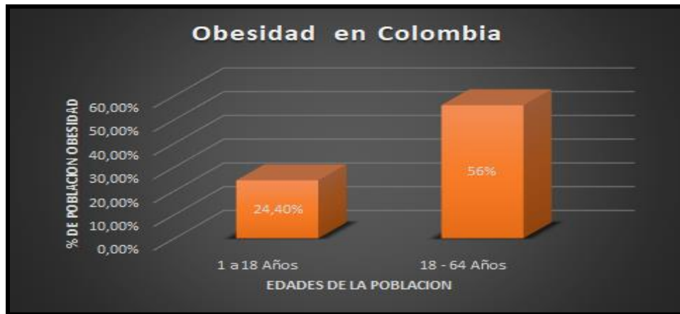
Ilustración 2. Encuesta Nutricional Colombia 2015 - 2016: Representación gráfica de porcentaje de obesidad poblacional asociado con años de vida.

La obesidad se ha posicionado como un problema de salud pública y ha propiciado que el Gobierno Nacional promueva iniciativas para el consumo de alimentación sana, baja en grasas y en azúcares, en la siguiente grafica podemos observar el resultado de esta observación.