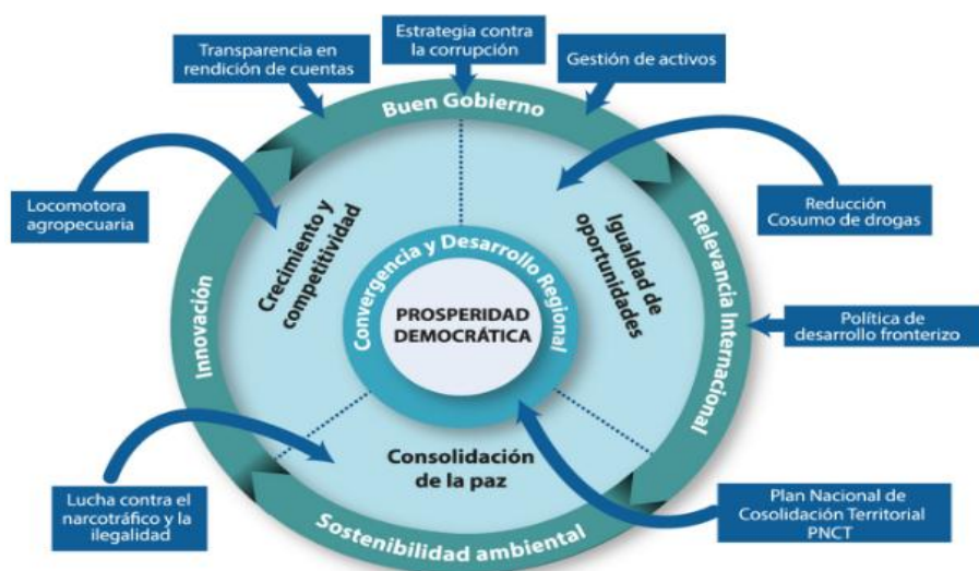
Figura 1. Ejes de la política antidrogas en Colombia