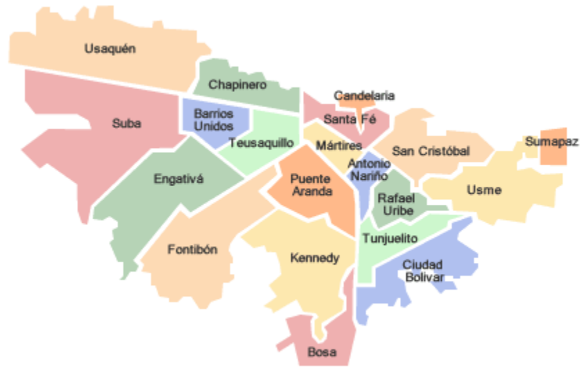
Figura 2. Ubicación de la Localidad de Puente Aranda