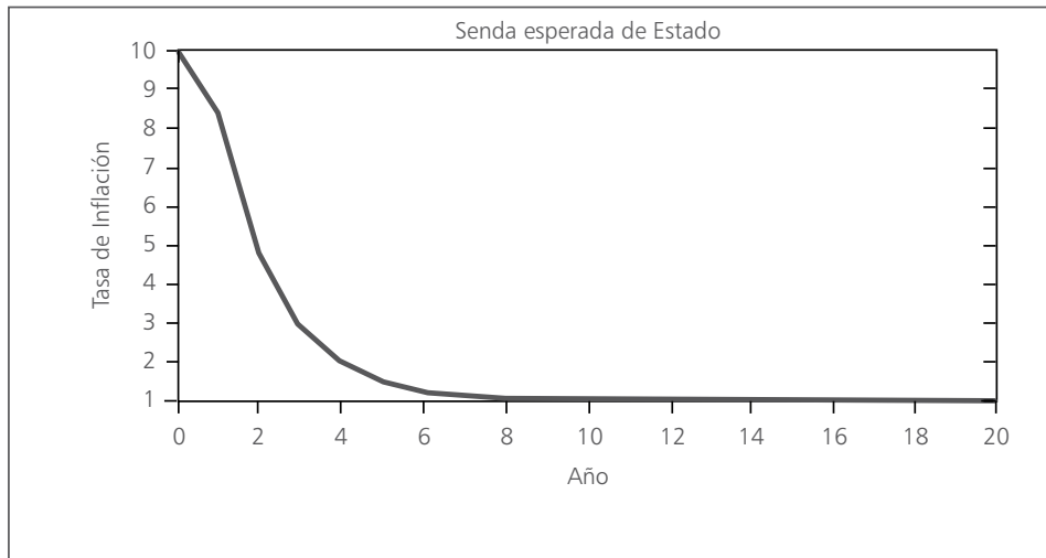
Senda esperada de la tasa de inflación